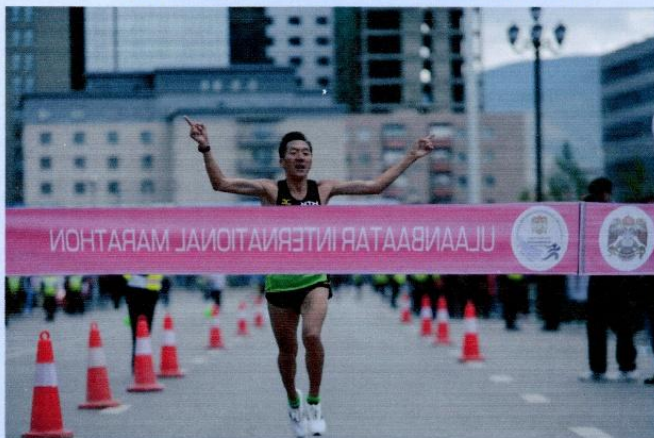
МУГТ Б.Сэр-Од, 42км 195м 1-р байр