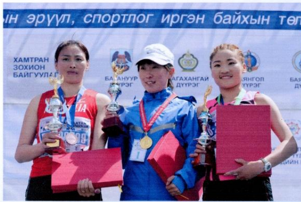
Хагас марафон гүйлтийн тэмцээний шилдэг тамирчид