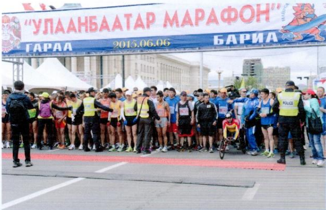
ФОТО ШИГТГЭЭ /Тэмцээний явц/