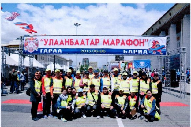
Олон улсын тэмцээний шүүгчид