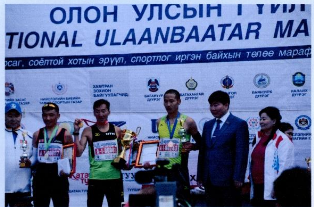
Бүтэн марафон гүйлтийн тэмцээний шилдэг тамирчид